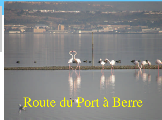
Route du Port à Berre