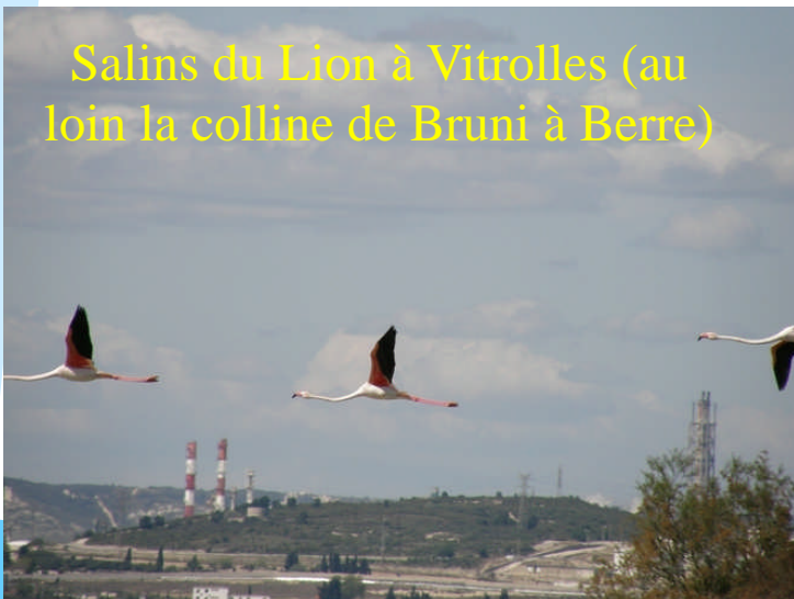
Salins du Lion à Vitrolles (au loin la colline de Bruni à Berre)

Ces zones de prédilection sont : La petite Camargue de St-Chamas, les Salins de Berre et la route du Port, les Salins du Lion à Vitrolles près de l'aéroport et le Bolmon à Marignane.