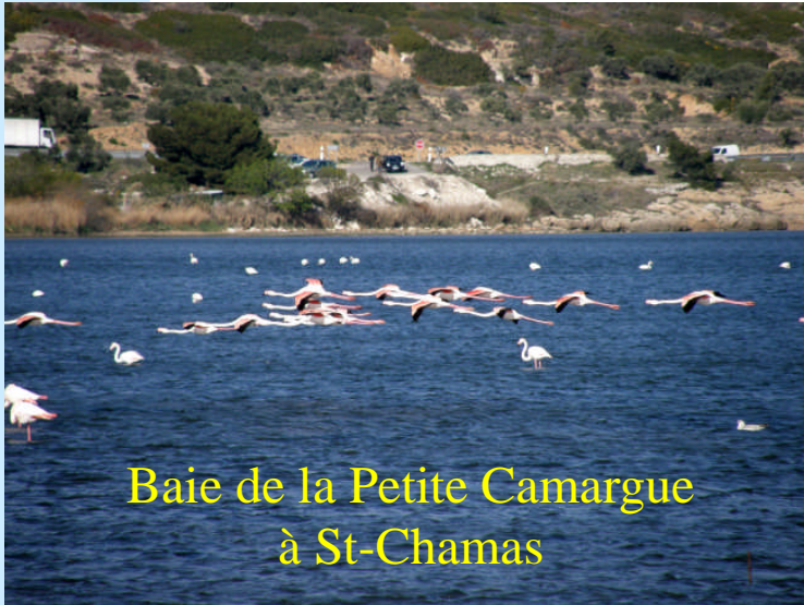
Baie de la Petite Camargue à St-Chamas